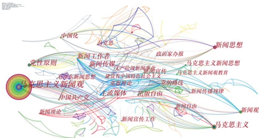
图2 马克思主义新闻观研究关键词共现图谱